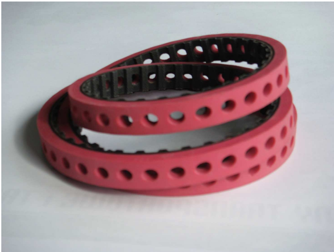
Pas zębaty gumowy typu 367L050 + perforacja, pokryte czerwonym linatexem 5 mm.